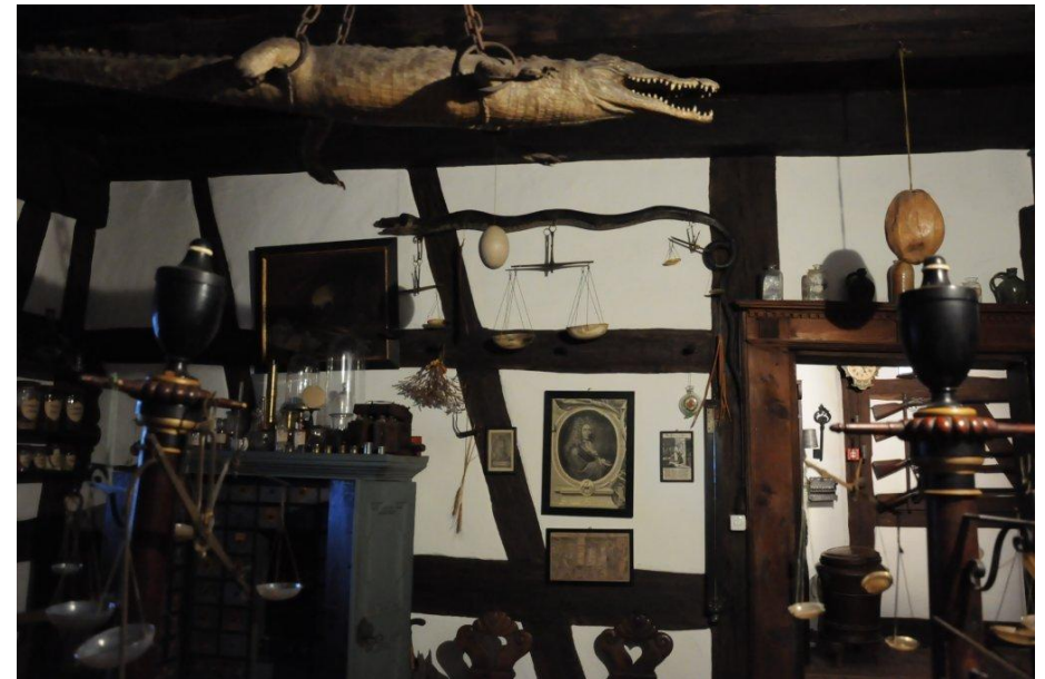
Ein wahres Sammelsurium, die alte Apotheke

Mitten im mittelalterlichen Städtchen befindet sich das Haus zum Goldenen Leuen. Es beherbergt eine einzigartige pharmazie-historische Sammlung und andere Raritäten und Kuriositäten, die von drei Generationen der Diessenhofer Apothekerfamilie Brunner zusammengetragen wurden. Besichtigungen nur in geführten Gruppen von je max. 10 Personen jeweils von Mai bis Oktober. Auskunft erteilt: 052 675 16 16, www.stiftungzumgoldenenleuen.ch