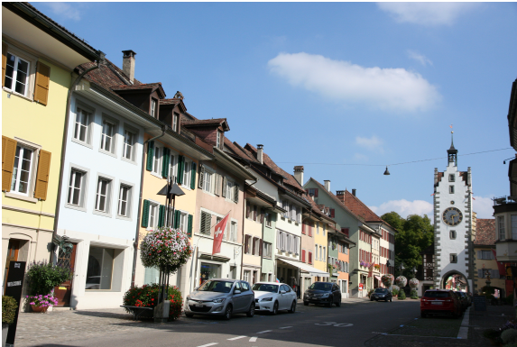
Die Altstadt von Diessenhofen

Das malerische Städtchen mit seiner mittelalterlichen Altstadt und einer schönen Kirche Diessenhofen liegt direkt am Rhein. Eine gedeckte Holzbrücke führt über den Rhein nach Deutschland. Alles Wissenswerte: www.diessenhofen.ch/tourismus