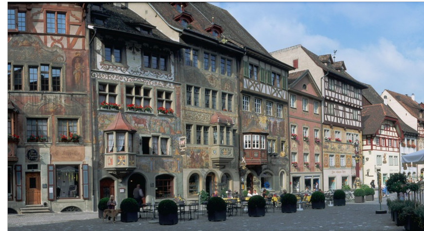
Ausflug nach Stein am Rhein