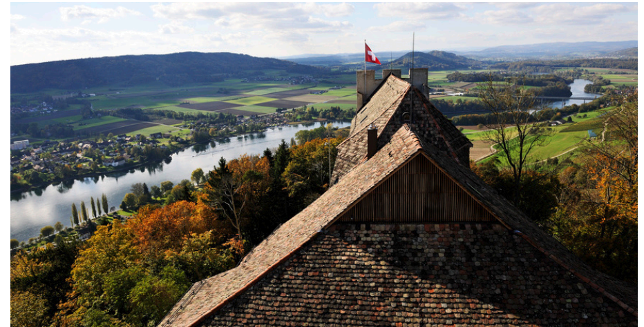
Burg Hohenklingen mit Blick auf den Rhein

Sehenswürdigkeiten sind neben der Altstadt das Kloster St. Georgen , eine der am besten erhaltenen mittelalterlichen Klosteranlagen, das Museum Lindwurm für bürgerliche Wohnkultur und Landwirtschaft im 19. Jahrhundert sowie das Naherholungsgebiet mit der Inselgruppe Werd. Die 1225 erbaute Burg Hohenklingen hoch über dem Städtchen lässt die bewegte Geschichte von Stein am Rhein wiederauferstehen.