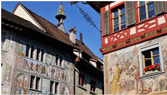
Prächtige Wand-Malereien

Wo der Untersee wieder zum Rhein wird, liegt das Städtchen Stein am Rhein. Es ist berühmt für seinen wunderbar erhaltenen Altstadtkern mit bemalten Häuserfassaden und Fachwerkhäusern, für die es 1972 den